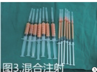
图 3 PRF + 颗粒脂肪混合注射