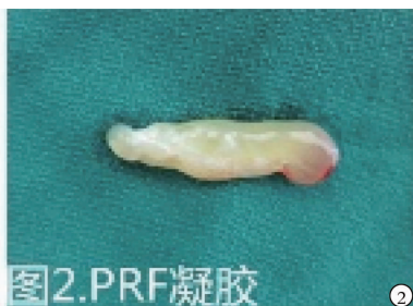
图 2 PRF 凝胶